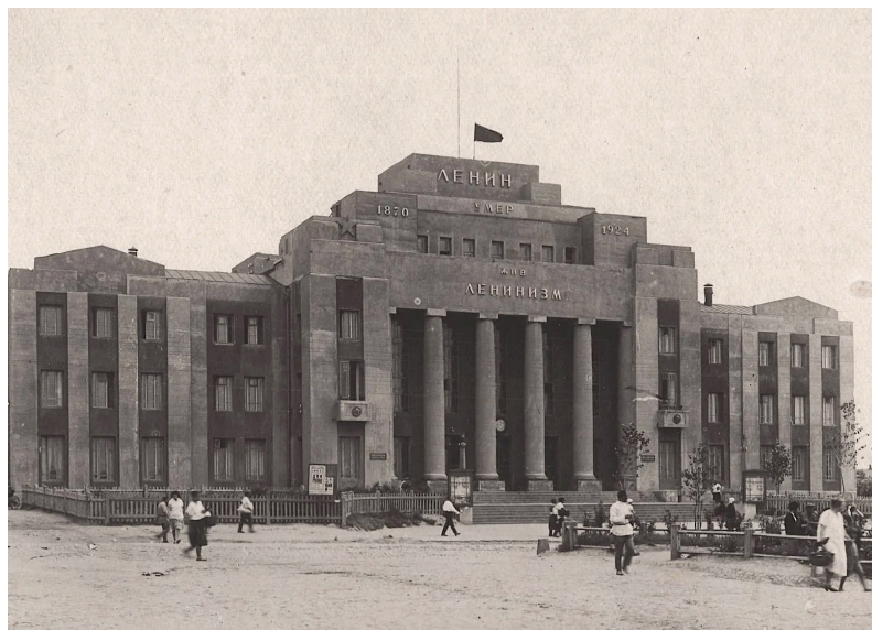
Ил. 4. М.С. Купцов, И.А. Бурлаков и др. Дом Ленина в Новосибирске. 1924–1926.

Времена, когда скульптор Шадр стоял на распутье, прошли, но ему так и не суждено было осуществить свой грандиозный замысел. На протяжении последующих лет, вплоть до самой смерти, он неоднократно возвращался к концепции памятника Мировому страданию — например, в проекте монументального маяка-памятника Христофору Колумбу [12, с. 6–7; 36, с. 100–104]. И все-таки судьба распорядилась иначе: Шадр прославился прежде всего как автор отдельных статуй агитационного характера и надгробий для советской элиты. Что касается урало-сибирского турне, то оно долгие десятилетия оставалось за рамками официальной биографии скульптора.