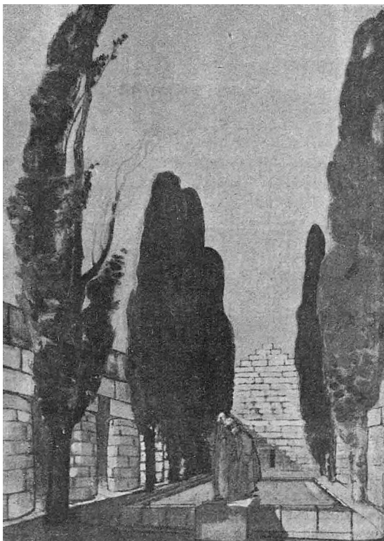
Ил. 2. И.Д. Шадр. Проект памятника Мировому страданию. Эскиз (перистиль). Конец 1910-х гг. [34, с. 23]

коридоров и, наконец попадал в залитую светом «Часовню Воскресения» [33, с. 24].