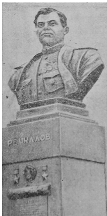
Илл. 8. Крамской М.П. Бюст Г.А. Речкалова. 1949. Бронза. Свердловская область, п. Зайково Ирбитского района

Свердловское искусство и культурно-шефская помощь Красной армии: предыстория взаимоотношений в послевоенное время (1946–1952)