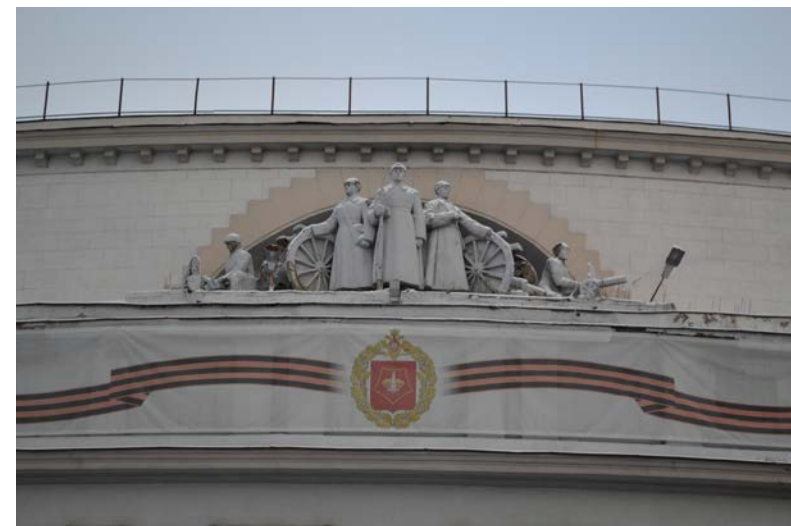
Илл. 3. Фрагмент фронтона здания Дома офицеров Центрального военного округа. Екатеринбург. 2020

Шпиль Дома офицеров, увенчанный звездой, — третий ярус здания. В отличие от сияющего золотом шпиля с корабликом Главного адмиралтейства, в свердловском здании эта часть возведена из скромного камня. И вызывает, благодаря свойствам строительного материала, оптико-осозательное ощущение тяжеловесности скрепленных между собой отдельных блоков. Окна этажей всех ярусов сделаны узкими, чтобы не нарушить четкий центр сооружения. А главный вход размещен в крыле корпуса, фасад которого декорирован портиком, фронтоном и колоннадой пилястр с неокоринфскими капителями советской символики. Общее впечатление величия и мужественности форм здания не смягчается декоративной лепниной, в содержательном отношении связанной с советской армией, а наоборот, усиливается: барельефные гербы СССР на башне, овалы выпуклые рельефы с эмблемами военной семантики вдоль всего корпуса первого этажа и скульптурные композиции фигур красноармейцев и пушек на фронтоне. На одной из стен башни ранее также имелось барельефное изображение И.В. Сталина, демонтированное после XX съезда КПСС.