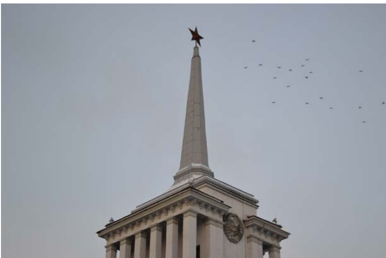
Илл. 2. Шпиль здания Дома офицеров Центрального военного округа. Екатеринбург. 2020