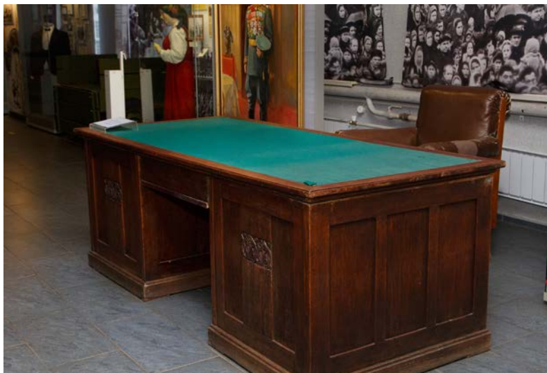
Илл. 6. Стол Г.К. Жукова. 1948–1953 годы. Свердловский областной краеведческий музей им. О.Е. Клера

входа — стол заседаний, слева на стене — карта территории округа, задернутая матерчатыми шторками» [3, с. 83].