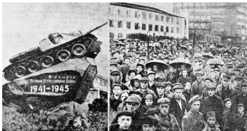
Илл. 7. Открытие памятника СУ-100. 1946. Фотография из газеты «Уральский рабочий»