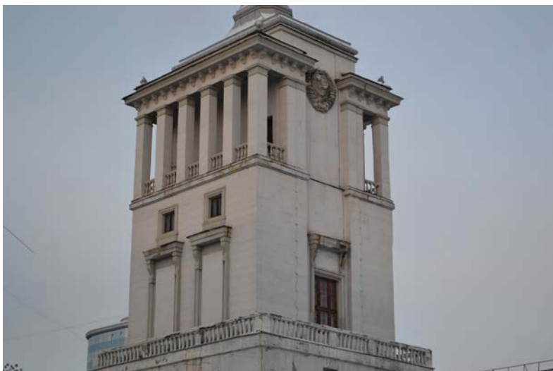
Илл. 1. Фрагмент башни здания Дома офицеров Центрального военного округа. Екатеринбург. 2020

Свердловское искусство и культурно-шефская помощь Красной армии: предыстория взаимоотношений в послевоенное время (1946–1952)