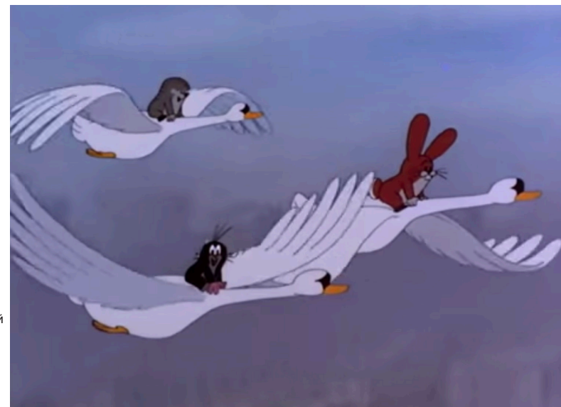
Ил. 8. Лебеди уносят Кротика и друзей в лесной рай. «Кротик в городе», 1982, художник и режиссер Зденек Милер

Экспансия камерности. Мультфильм Зденека Милера «Кротик в городе» как сатира на общество Чехословакии времен нормализации