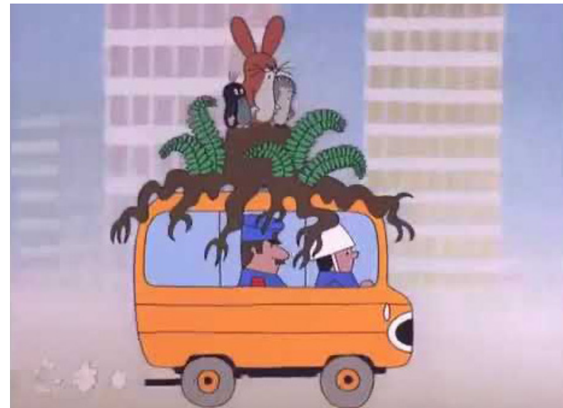
Ил. 3. Мир трио друзей вырван с корнем. «Кротик в городе», 1982, художник и режиссер Зденек Милер

Экспансия камерности. Мультфильм Зденека Милера «Кротик в городе» как сатира на общество Чехословакии времен нормализации