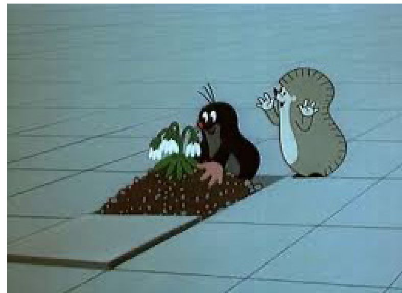
Ил. 6. Спасение цветка. «Кротик в городе», 1982, художник и режиссер Зденек Милер

Экспансия камерности. Мультфильм Зденека Милера «Кротик в городе» как сатира на общество Чехословакии времен нормализации