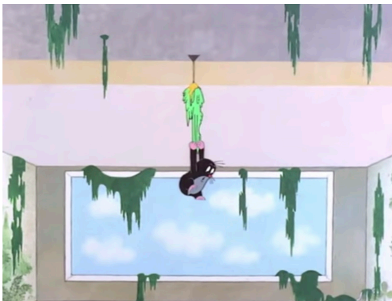
Ил. 5. Фальшивый мир лопается, не выдержав контакта с естественностью и живой стихией. «Кротик в городе», 1982, художник и режиссер Зденек Милер

Экспансия камерности. Мультфильм Зденека Милера «Кротик в городе» как сатира на общество Чехословакии времен нормализации