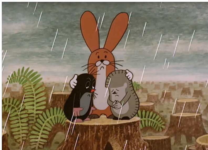
Ил. 1. Кротик, Ежик и Заяц горюют по уничтоженному дому. «Кротик в городе», 1982, художник и режиссер Зденек Милер