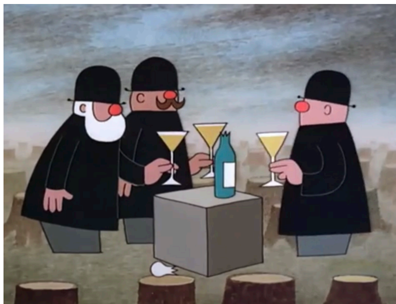
Ил. 2. Чиновники без глаз, с печатями вместо души. «Кротик в городе», 1982, художник и режиссер Зденек Милер

Экспансия камерности. Мультфильм Зденека Милера «Кротик в городе» как сатира на общество Чехословакии времен нормализации