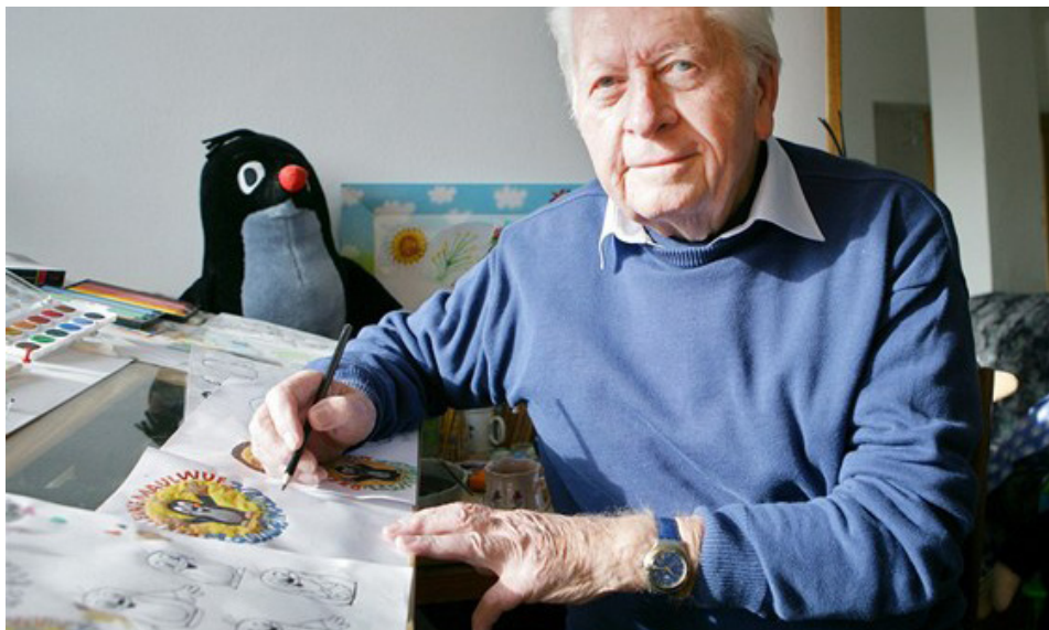
Илл. 9. Зденек Милер со своим знаменитым персонажем Кротиком

Экспансия камерности. Мультфильм Зденека Милера «Кротик в городе» как сатира на общество Чехословакии времен нормализации