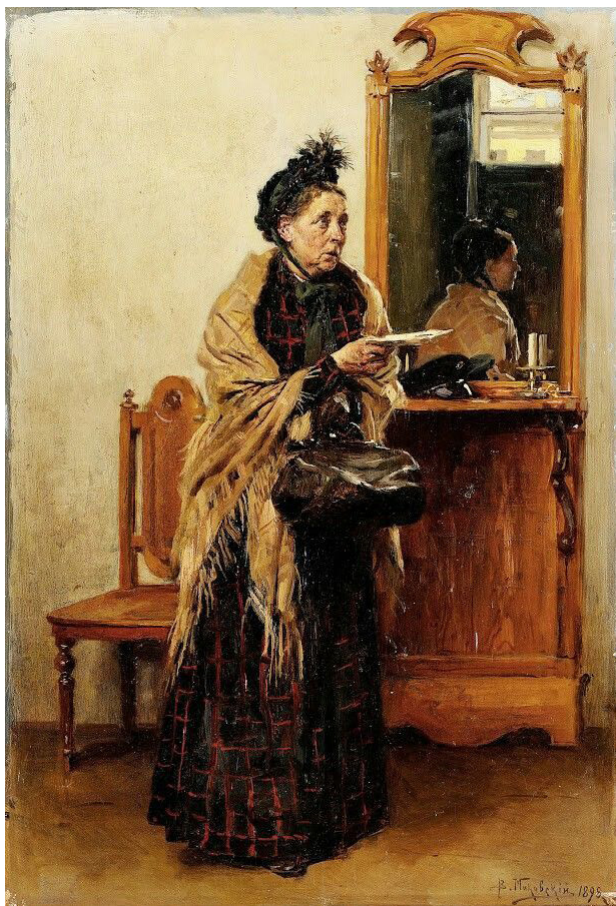
Ил. 4. Маковский В.Е. Просительница. 1898. Картон, масло. 40,5 × 27,8 см. Частное соборание

голодающим. М., 1892. Эти серии рисунков ценны не только тем, что были сделаны при жизни Л.Н. Толстого, но и тем, что создавались в содружестве с ним, при его непосредственном участии.