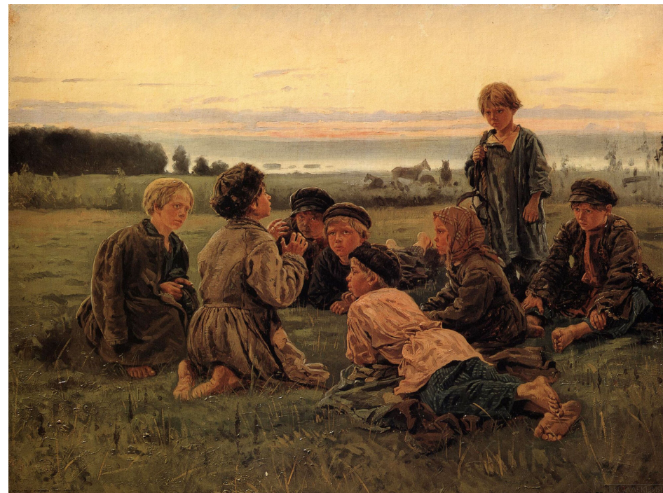
Ил. 2. Маковский В.Е. Ночное. 1879. Холст, масло. 62 × 77 см. Государственный Русский музей, Санкт-Петербург

Персонажи жанровой сценки В.Е. Маковского «В четыре руки» (1880) напоминали современникам Фомушку и Фимушку Субочевых из тургеневской «Нови» (1877), а также «современных Филемона и Бавкиду» или Пульхерию Ивановну и Афанасия Ивановича из «Старосветских помещиков» Н.В. Гоголя (1835) [2, с. 41]. Подобное двойное сравнение неслучайно, ведь в «Нови» «тургеневская теплота идет рука об руку с чисто гоголевским комизмом» [26, с. 2]. Намеренно вводя гоголевские художественные приемы, И.С. Тургенев