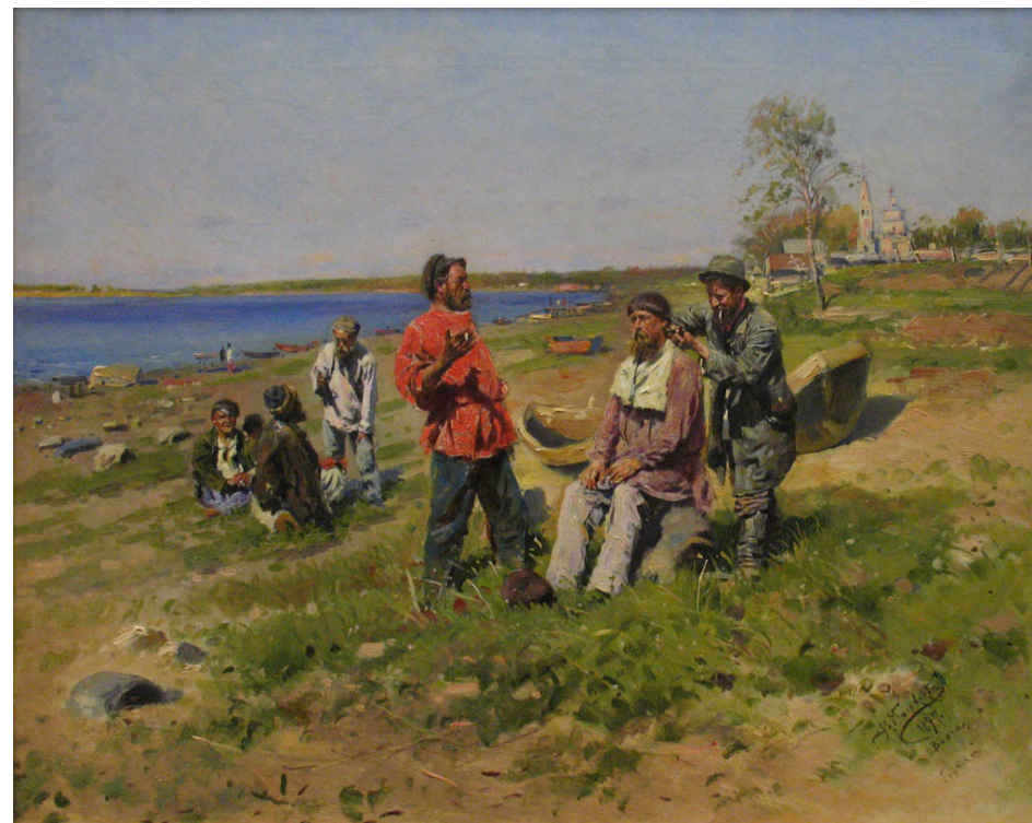
Ил. 5. Маковский В.Е. Стригут. Волжский Фигаро. 1897. Холст, масло. 51,3 × 64,5 см. Национальный художественный музей Республики Беларусь, Минск

широкая панорама реки, богатство палитры, яркость чистых красок — все передает многообразие эмоций.