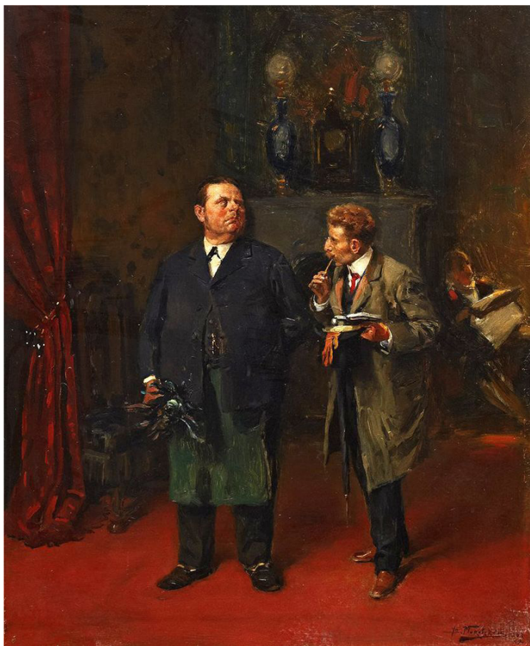
Ил. 6. Маковский В.Е. Интервью. 1903. Дерево, масло. 35 x 45 см. Собрание А.Н. Володчинского

нации представлены в картине В.Е. Маковского «Крах банка» (1881) и в фельетоне А.П. Чехова «Дело Рыкова и комп.» (1884). А непростая судьба сельской учительницы находит свое воплощение в картине В.Е. Маковского «Приезд учительницы в деревню» (1896–1897) и рассказе А.П. Чехова «На подводе» (1897). Сюжетная коллизия, построенная на противопоставлении мастерового, работающего в городе, и его жены, живущей в деревне, представлена в картине В.Е. Маковского «На бульваре» (1887) и рассказе А.П. Чехова «В овраге» (1899).