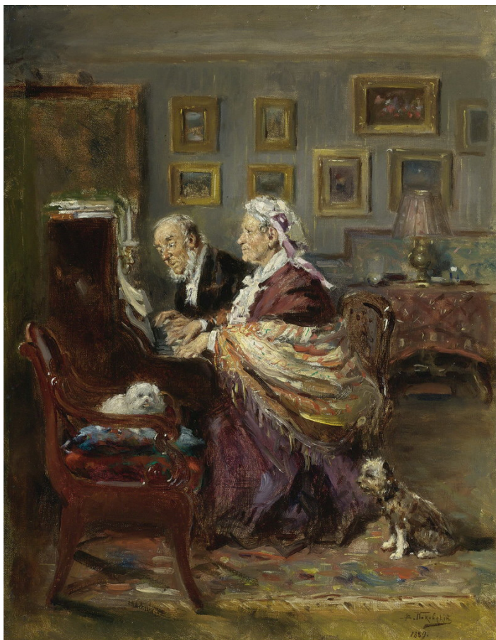
Ил. 3. Маковский В.Е. В четыре руки. 1889. Холст, масло. 40,5 × 32,6 см. Частное соборание

жизни пожилой пары в торжественное событие. Примечательно, что настоящим «Тургеневым в живописи» называл В.Е. Маковского его ученик, художник В.Н. Бакшеев [4, с. 61].