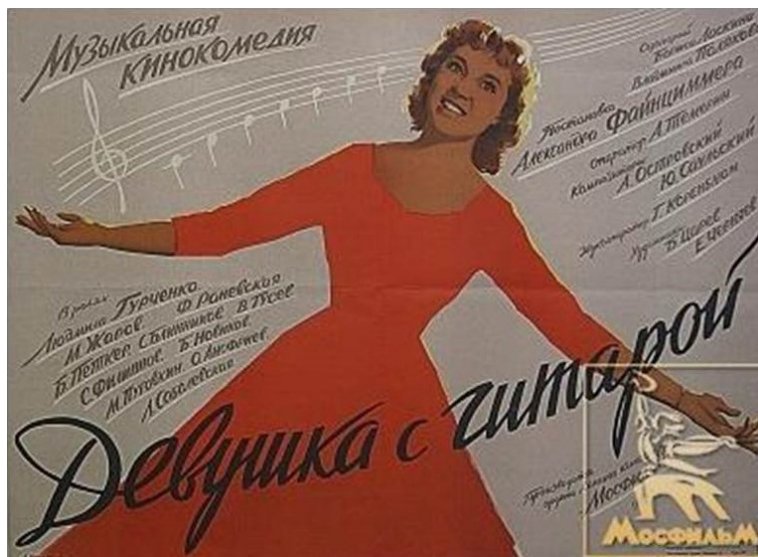
Ил. 11. Афиша фильма «Девушка с гитарой», режиссер Александр Файнциммер, 1958.

Fig. 10. Poster for Encounter at the Elbe , directed by Grigory Alexandrov, 1949.