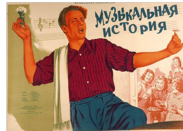
Ил. 3. Афиша фильма «Музыкальная история», режиссеры Александр Ивановский и Герберт Раппапорт, 1940.

Fig. 1. Poster for A Sixth Part of the World , directed by Dziga Vertov, 1926.