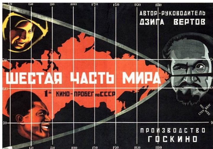
Ил. 1. Афиша фильма «Шестая часть мира», режиссер Дзига Вертов, 1926.

Fig. 1. Poster for A Sixth Part of the World , directed by Dziga Vertov, 1926.