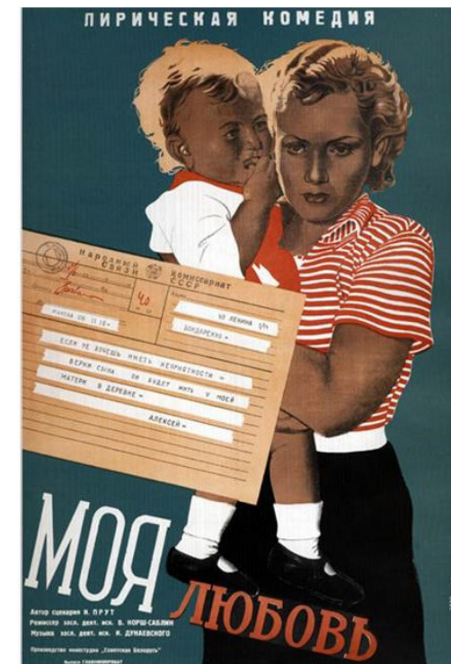
Ил. 4. Афиша фильма «Моя любовь», режиссер Владимир Корш-Саблин, 1940.

Fig. 2. Early poster for Jolly Fellows , directed by Grigory Alexandrov, 1934.