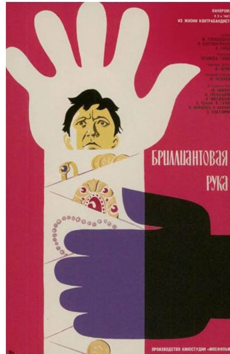
Ил. 12. Афиша фильма «Бриллиантовая рука», режиссер Леонид Гайдай, 1969.

Fig. 11. Poster for A Girl with Guitar , directed by Alexander Faintzimer, 1958.