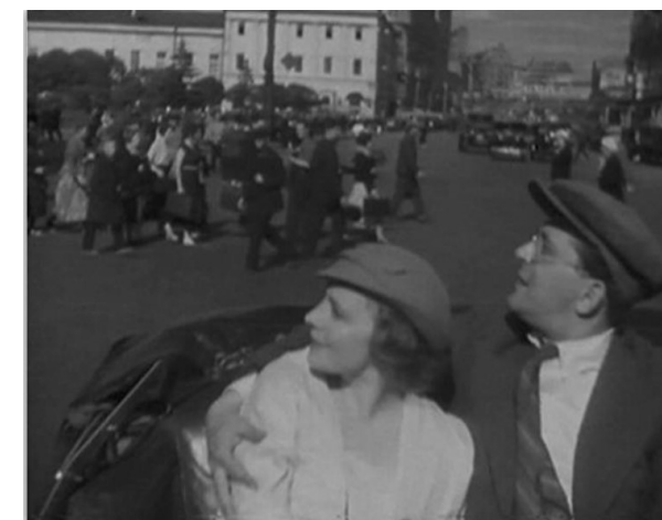
Ил. 9. Кадр из фильма «Девушка спешит на свидание», режиссеры Михаил Вернер и Сергей Сиделев, 1936. Fig. 9. Still from Late for a Date , directed by Mikhail Verner and Sergei Sidelev, 1936.