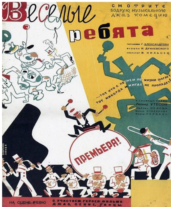
Ил. 2. Ранняя афиша фильма «Веселые ребята», режиссер Григорий Александров, 1934.

Fig. 3. Poster for Musical Story , directed by Alexander Ivanovsky and Herbert Rappaport, 1940.