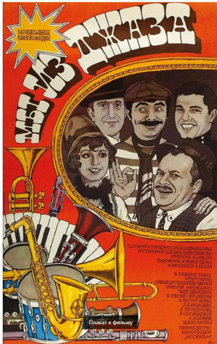
Ил. 7. Афиша фильма «Мы из джаза», режиссер Карен Шахназаров, 1983. Fig. 7. Poster for We Are from Jazz , directed by Karen Shakhnazarov, 1983.

Ил. 8. Афиша фильма «Рейс мистера Ллойда», режиссер Дмитрий Бассальго, 1927.