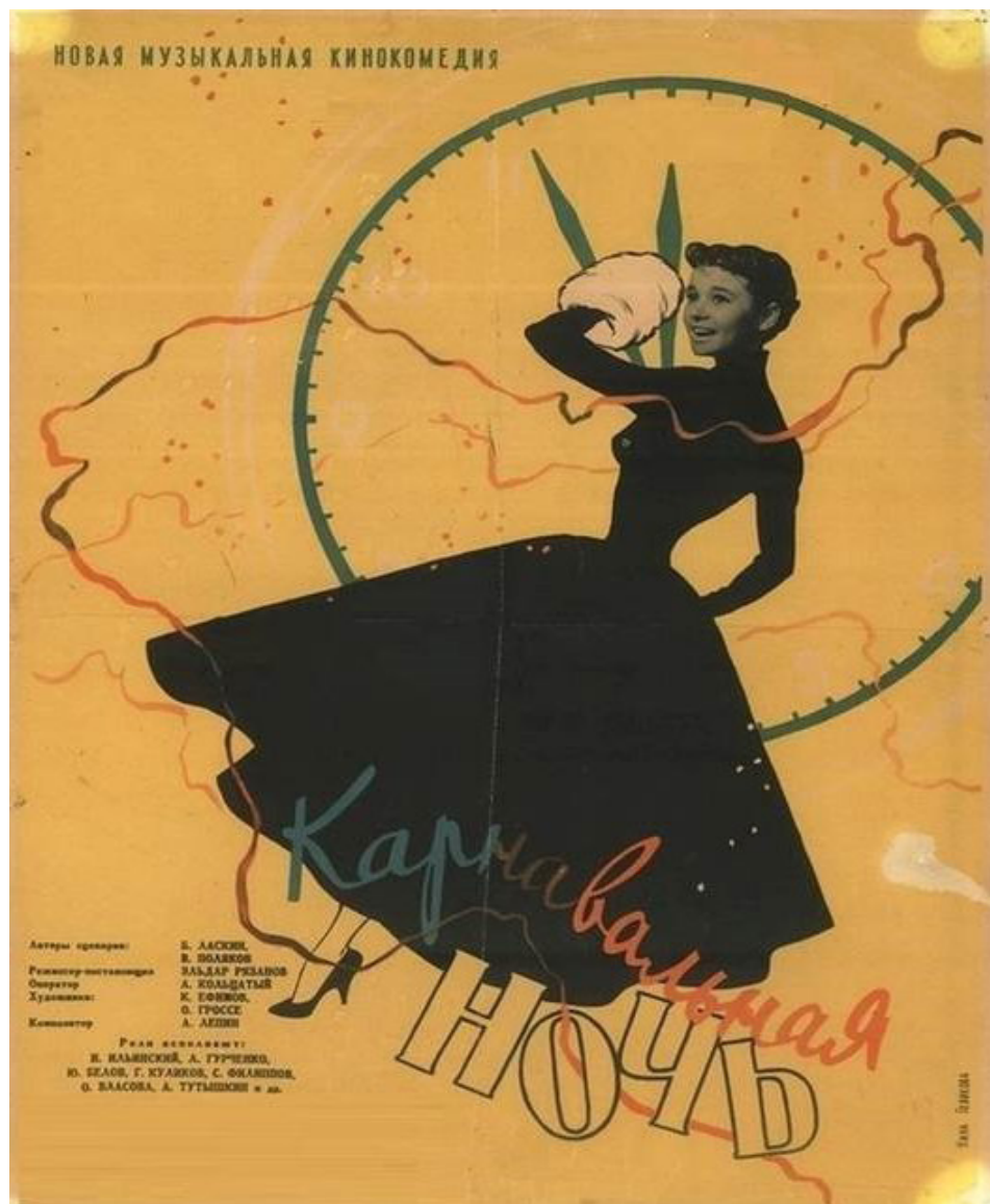
Илл. 5. Афиша фильма «Карнавальная ночь», режиссер Эльдар Рязанов, 1956.

Fig. 5. Poster for Carnival Night , directed by Eldar Ryazanov, 1956.