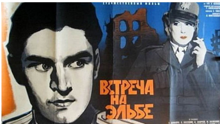
Ил. 10. Афиша фильма «Встреча на Эльбе», режиссер Григорий Александров, 1949.

Fig. 10. Poster for Encounter at the Elbe , directed by Grigory Alexandrov, 1949.