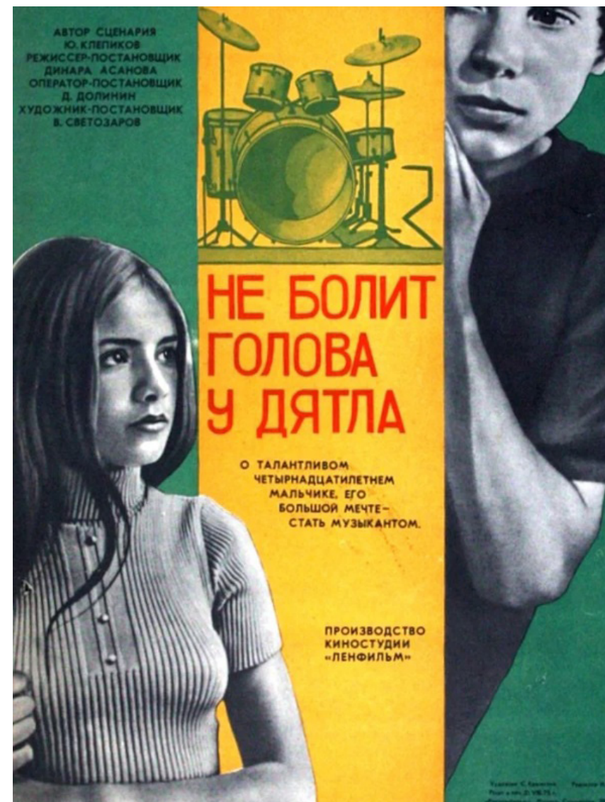
Илл. 6. Афиша фильма «Не болит голова у дятла», режиссер Динара Асанова, 1974.

Fig. 5. Poster for Carnival Night , directed by Eldar Ryazanov, 1956.