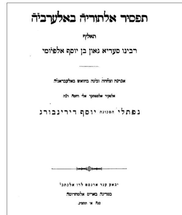
Илл. 1. Садиа Гаон. Комментарий к Торе

вызов собственному материально-духовному наследию. Пабло Альваро из Кордовы (ум. 861) — богослов и поэт еврейского происхождения, критиковал молодежь за ее арабизированность, ассимиляторство и скудные познания в латыни [1, с. 25–29]: «Я вопрошаю, можно ли найти сегодня ученого человека среди мирян, кто, обладая знанием Священного Писания, изучал бы латинские книги каких-либо богословов? Кто сейчас горит евангельской любовью, любовью такой, как была у пророков, как была у апостолов? Разве не все юные христиане, миловидные, речистые, заботящиеся о своем платье и манерах, известные своим знанием языческой жизни, уважаемые за свою способность говорить по-арабски, — разве не все они с увлечением читают книги халдейские (6) <...> и при этом не ведают красы Церкви