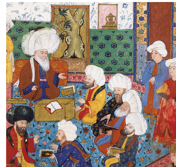
Илл. 3. Обучая закону. Фрагмент миниатюры из Дивана Абд аль-Баки (сер. XVI в.)

( makrūh ), в отличие от „дозволенного“ ( halāl )» [22, с. 5]. Если бы это было так, история не зафиксировала бы известные публичные казни музыкантов за то, что их игра и пение собирали больше народу, чем проповеди пророка Мухаммада, даже при всей жесткости религиозной экспансии первых десятилетий и локальном волонтаризме отдельных правителей.