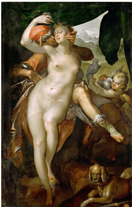
Ил. 5. Спрангер Б. Венера и Адонис. 1597. Холст, масло. 163 × 104 см. Музей истории искусств, Вена

и дон Фелипе выглядит то как смелый и благородный рыцарь, то как жалкий паралитик. В целом в «Благочестивой Марте», как и во многих комедиях Тирсо, заметен контраст между драматизмом (дон Фелипе убил на дуэли брата доньи Марты, и его разыскивают, чтобы предать суду) и потехой. Но доминирует дурачество, шутовство, игра, карнавальное начало.