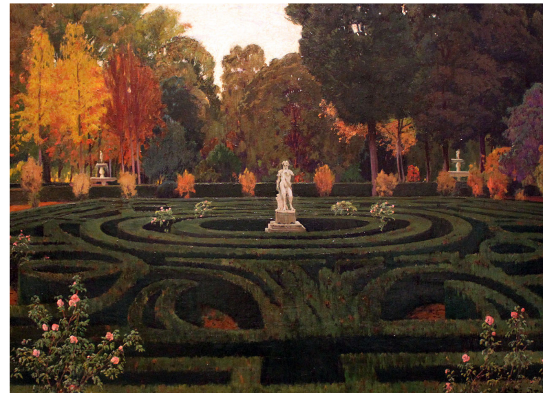
Ил. 3. Русильон С. Старый фавн. (Серия «Цветники Аранхуэса»). 1911. Холст, масло. 118 × 146 см. Центр искусств королевы Софии, Мадрид

Напрасные попытки умерщвления плоти драматург высмеивает в комедии «Через чердак и подъемник» (Por el sótano y el torno), о которой уже шла речь. Бернарда, держащая взаперти пятнадцатилет-