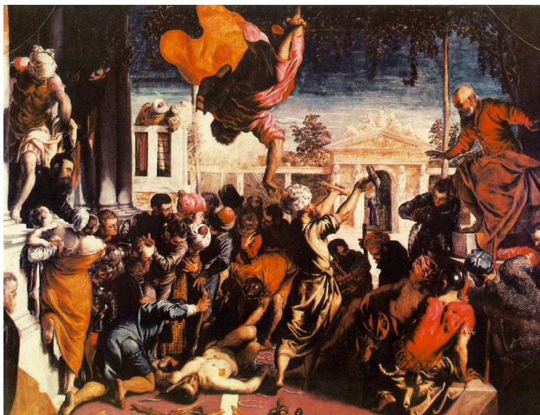
Илл. 6. Тинторетто. Чудо святого Марка. 1548. Холст, масло. 41,5 × 54,1 см. Галерея Академии, Венеция

Можно ли, даря жизнь другу, Убивать себя? [14].