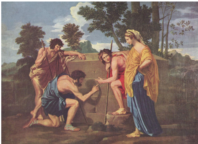
Ил. 4. Пуссен Н. Аркадские пастухи (Et in Arcadia ego). 1637–1638. Холст, масло. 85 × 121 см. Лувр, Париж

misma, 1620). К столичной красавице донье Магдалене прибывает из Леона дон Мельчор, за которого ее заочно сосватали. Жених не торопится надеть супружеское ярмо с той, которой никогда не видел, и испытывая восторг провинциала от блеска столичных дам, увлекается одной из прихожанок в храме, в который зашел по дороге к суженой. Он видит ее на богослужении только со спины, но она кажется ему ошеломляюще грациозной. Любуясь прелестью показывающейся из-под мантии руки, Мельчор рисует в воображении ее изумительный облик. Портрет незнакомки, творимый фантазией, настолько хорош, что, когда он прибывает в дом к Магдалене, она кажется ему куда менее привлекательной, чем та, за которой он стал пылко ухаживать. В конце этой встречи Магдалена, опасаясь, что назойливый кавалер может скомпрометировать ее, велела своему слуге сказать, что она — графиня Чихинола. Теперь, услышав, как Мельчор у нее в гостях шепчется со слугой Вентурой, что хозяйка дома не так хороша, как божественная графиня, Магдалена решает под видом