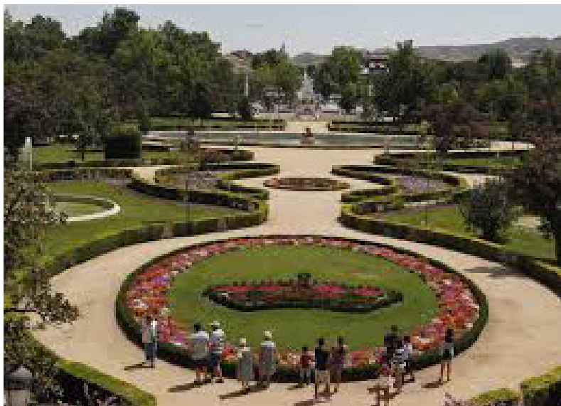
Ил. 2. Сады Аранхуэса под Мадридом. Фотография

тые грозят смертью, белые воплощают чистоту (v.v. 1779–1786). Как и в ряде других комедий, Тирсо, предельно точно обозначив место действия, вместе с тем словно бы переносит героев и героинь в другой мир, показывая, как они добиваются своего рода экстерриториальности. Они устанавливают свои невероятные порядки — и оказывается дозволенным непозволительное и возможным невозможное. Поэтически одухотворенный сад, полный благоухания и влаги, дарящий благолепие в изнывающем от жары и жажды Мадриде, превращается в Оазис с большой буквы, идеальное заповедное место, отгороженное от всего обыденного. Театр Тирсо — мираж, становящийся оазисом, или оазис, становящийся миражом.