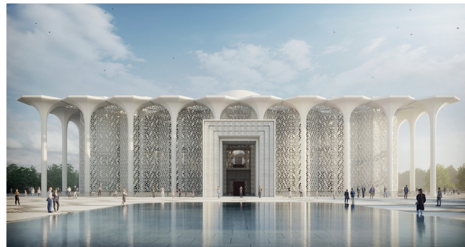
Ил. 6. Проект «Ак бахча» («Белый сад»). Ginzburg Architects (конкурсант № 15).

Инцидент казанской Соборной мечети: к истории одного архитектурного проекта