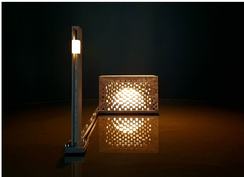
Ил. 11. Проект казанской Соборной мечети. Цимайло Ляшенко и Партнеры. 2023.

правда, не последовало). На сайте бюро размещена «концепция»: «Новое здание должно стать символом религии в стране и ее современным знаком. Этот статус определил архитектурную концепцию — прообразом будущей мечети стала Кааба, главная мусульманская святыня. Мечеть стоит на воде, соединяясь с берегом Волги с помощью общественной площади. Здание представляет собой черный куб, в центре которого находится молебельный зал. Традиционная для мечети форма купола отсылает к расположению молящихся вокруг Каабы. <...> Облик здания отражает сочетание светского и религиозного, открытого и в то же время сакрального. Решение фасадов развивает эту идею: каменные блоки сдвинуты таким образом, чтобы в кладке образовались просветы. Так купол зала можно увидеть с большого расстояния и с идущих по реке судов. Масштаб мечети подчеркивает единственный минарет, в котором находится смотровая площадка. Расположение на воде раскрывает значение слова: „минарет“ в переводе с арабского — „маяк“. Он символизирует духовный ориентир для верующих и в то же время является ориентиром в городе» [29].