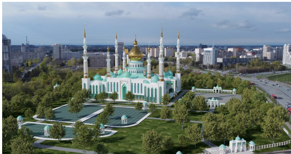
Ил. 4. Проект Творческой мастерской живописи РАХ в г. Казани (руководитель Ф.Г.Халиков) (конкурсант № 13).