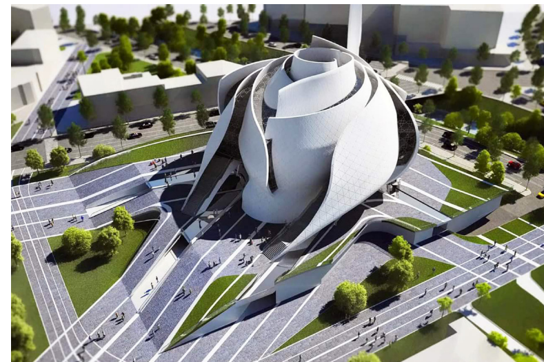
Ил. 10. Проект White Rose , Тирана. Архитектор Ф. Тоши. 2014.