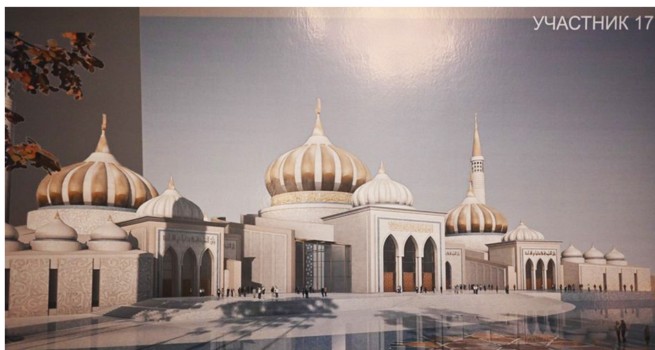
Ил. 5. Проект казанской Соборной мечети от конкурсанта № 17.

Инцидент казанской Соборной мечети: к истории одного архитектурного проекта