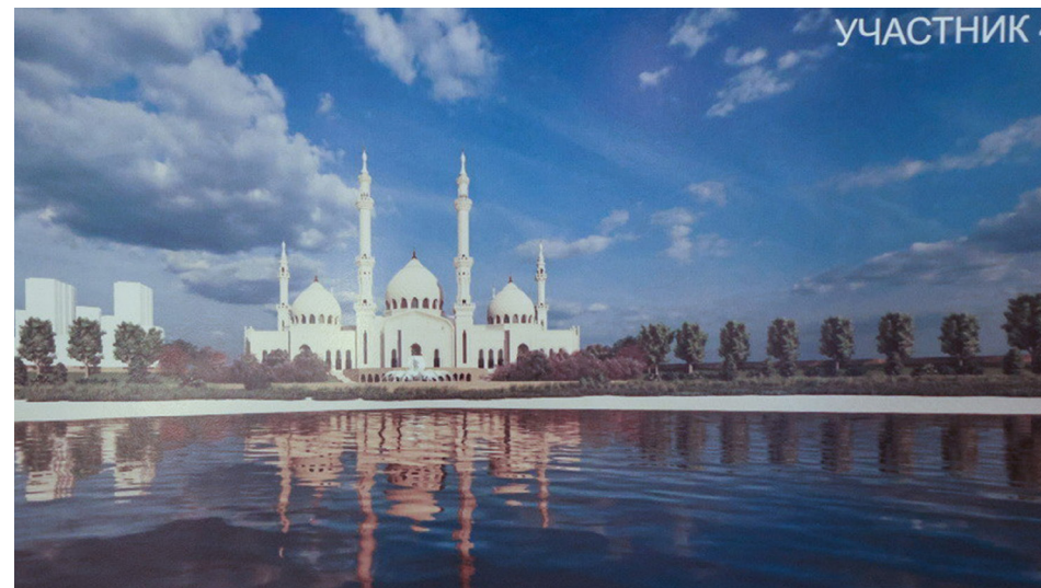
Ил. 1. Проект казанской Соборной мечети от конкурсанта № 4.

Кстати, «открытость» конкурса эскизов относилась, видимо, к возможности участия в нем, но не подразумевала знакомства широкой общественности с представленными проектами. Вероятно, моти-