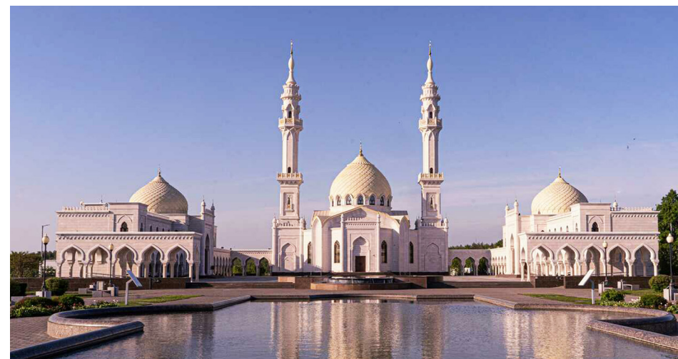
Ил. 2. Комплекс Белой мечети, Булгар. Архитектор С. Шакуров, 2010–2012.