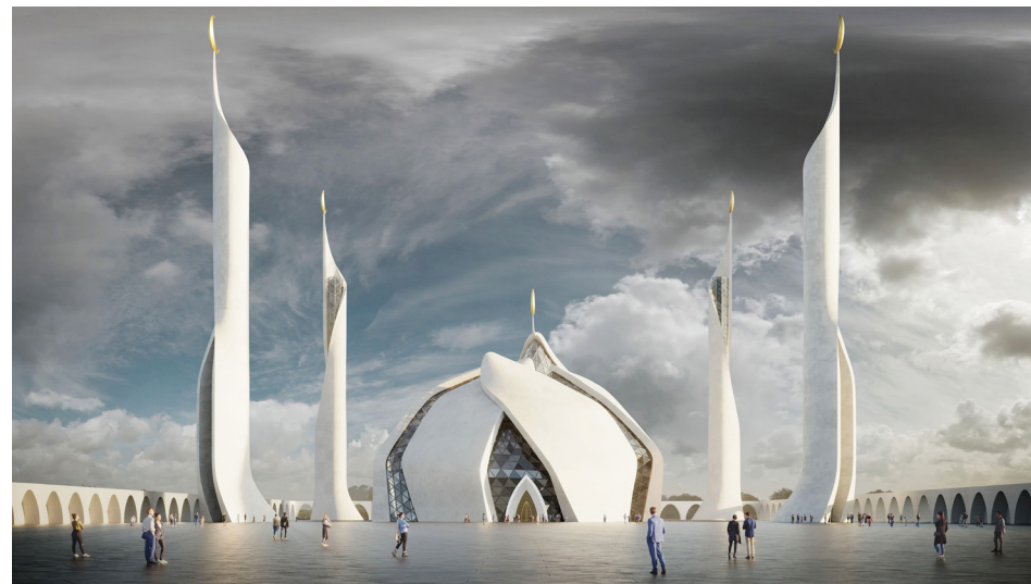
Ил. 9. Проект «Ак лалэ». Ginzburg Architects. 2023.

Очередной неожиданный проект Соборной мечети в Казани стал гвоздем конкурса «АРХ Москва 2023», причем бюро «Цимайло Ляшенко и Партнеры» заверяло публику, что именно предложенное ими решение уже одобрено руководством Татарстана (подтверждения,