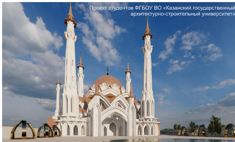
Ил. 3. Внеконкурсный проект казанской Соборной мечети, выполненный студентами КГАСУ.

виновалось это «чистотой эксперимента» — заботой о сохранении оригинальности творческих концепций... Правда, многие казанцы и не знали о проводимом к юбилею конкурсе, равно как и о планах удовлетворить их духовные нужды и подарить городу новое культовое сооружение, и смогли увидеть, какой может быть новая Соборная мечеть, только по окончании второго тура, когда официальная информация о его завершении и объявлении победителей стала доступна СМИ (с проектами-финалистами конкурса можно ознакомиться, например, на казанских сайтах [21; 26], откуда взята большая часть иллюстраций для данной статьи).