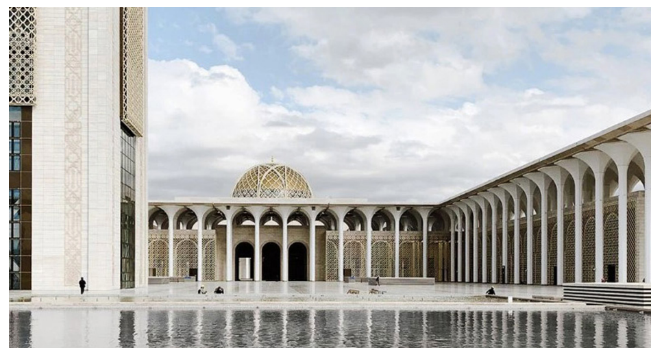
Ил. 7. Большая мечеть Алжира (Джама аль-Джазаир). Алжир, 2012–2019.