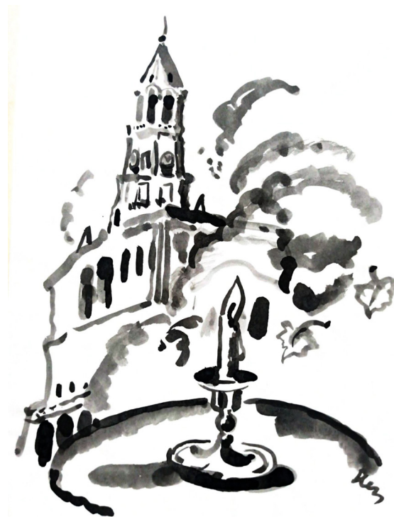
Ил. 4. Нестерова Н.И. Иллюстрация к хору «Зима» Д. Кривицкого. 1992. Акварель. 21 × 29,7 см. Личный архив Е.Д. Кривицкой (оригинал) Fig. 4. Nesterova N.I. Illustration for The Winter Chorus by D. Krivitsky. 1992. Watercolour. 21 × 29.7 cm. Personal archive of E.D. Krivitskaya (original)

Мне особенно лестно, что Наталья Нестерова бывала на моих органичных концертах, а в 2002 году даже написала картину «Играет Жень Кривицкая». На ней запечатлен антураж Малого зала Москов-