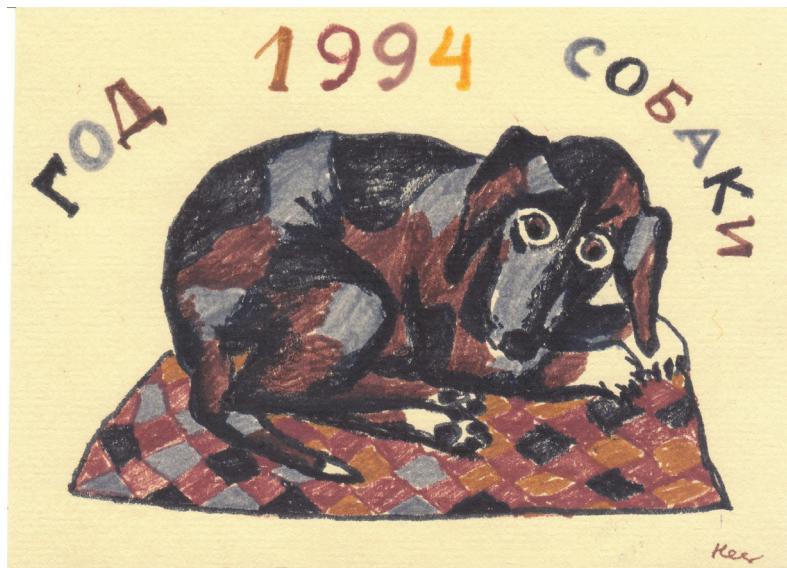
Ил. 3. Нестерова Н.И. Год собаки. Из серии «Знаки Зодиака». 1994. Аппликация. 9 × 13 см. Личный архив Е.Д. Кривицкой. Публикуется впервые Fig. 3. Nesterova N.I. The Year of the Dog. From The Zodiac Signs Series. 1994. Application. 9 × 13 cm. Personal archive of E.D. Krivitskaya. Published for the first time

на первом плане здесь натюрморт с фруктами. Но в иллюстрации к «Осени» птичья стая, взмывающая вверх над пустынным полем, становится главным мотивом.