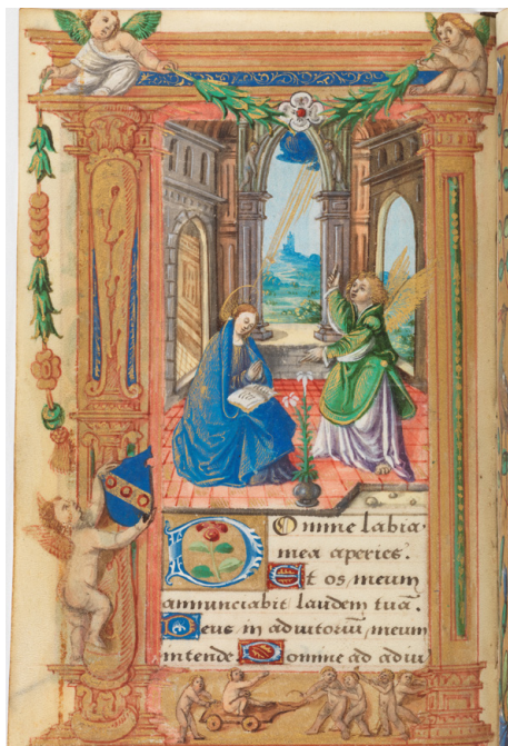
Илл. 6. Часослов Бениня Серра. Благовещение. Дижон, 1524. Собрание Heribert Tenschert, fol. 33v