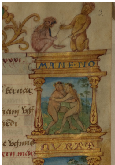
Илл. 1. Часослов де Сикона. Календарь, май. Бургундия, ок. 1530 г. Москва, Российская государственная библиотека, ф. 183 № 1911, fol. 3, фрагмент