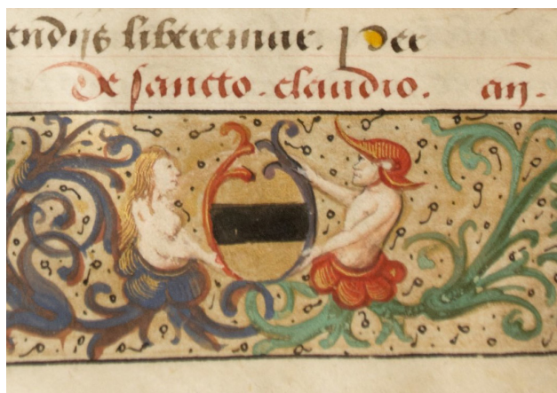
Илл. 9. Часослов де Сикона. Bas-de-page. Бургундия, ок. 1530 г. Москва, Российская государственная библиотека, ф. 183 № 1911, fol. 105 (фрагмент)

пухлыми путти колонны, фигурки на торах колонн и т. д. Это одинаковые надписи крупным шрифтом на базах и антаблементах (все три часослова).