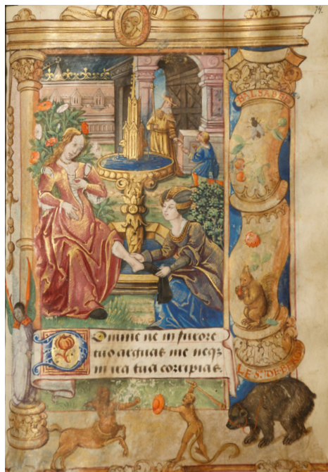
Илл. 11. Часослов де Сикона. Купающаяся Вирсавия. Бургундия, ок. 1530 г. Москва, Российская государственная библиотека, ф. 183 № 1911, fol. 74