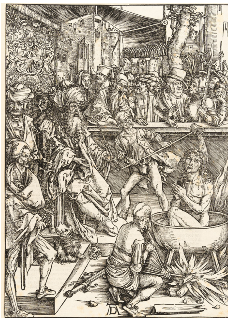
Илл. 16. Альбрехт Дюрер. Мученичество Св.Иоанна. Гравюра из серии «Апокалипсис». 1496-98