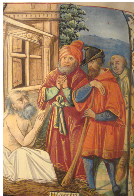
Илл. 13. Часослов де Сикона. Иов на гноище. Бургундия, ок. 1530 г. Москва, Российская государственная библиотека, ф. 183 № 1911, fol. 86v