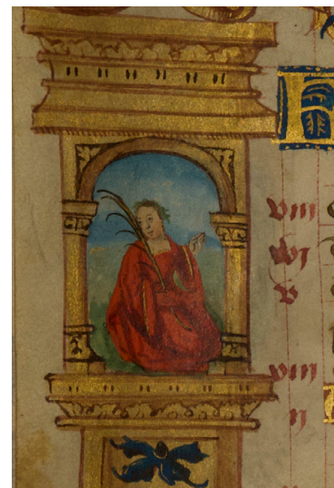
Илл. 3. Часослов де Сикона. Календарь, август. Бургундия, ок. 1530 г. Москва, Российская государственная библиотека, ф. 183 № 1911, fol. 4v, фрагмент