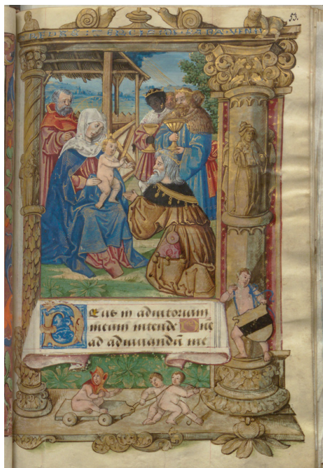
Илл. 5. Часослов де Сикона. Поклонение Волхвов. Бургундия, ок. 1530 г. Москва, Российская государственная библиотека, ф. 183 № 1911, fol. 53