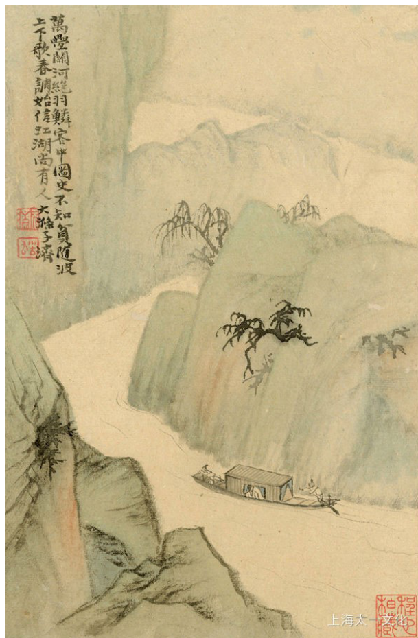
Илл. 6. Альбом «Странствие по реке», первый лист. Бумага, тушь, краски. Частная коллекция, Китай

К проблеме атрибуции альбомов «Десять пейзажей» и «Странствие по реке [кисти] Шитао»