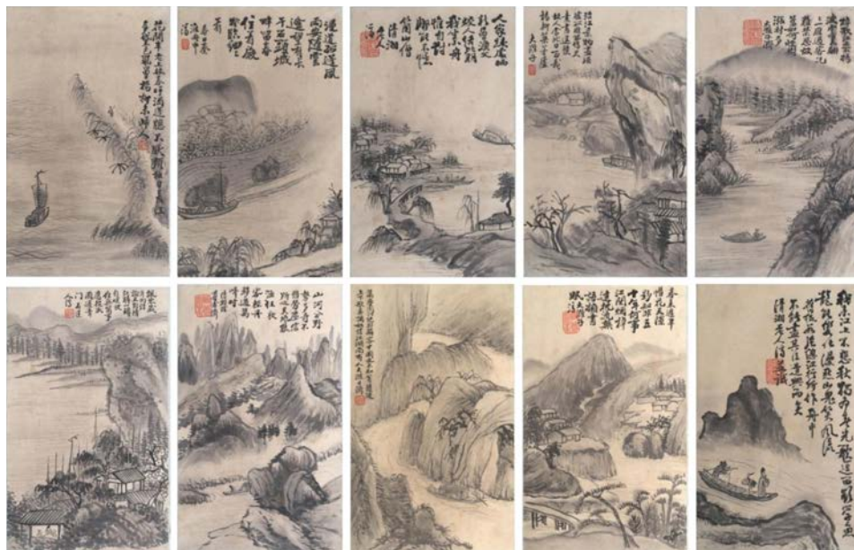
Илл. 1. Альбом «Десять пейзажей». Бумага, тушь. Государственный музей Востока, Москва

К проблеме атрибуции альбомов «Десять пейзажей» и «Странствие по реке [кисти] Шитао»