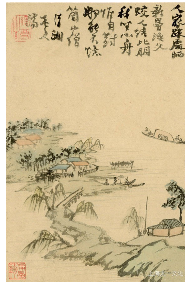
Илл. 4. Альбом «Странствие по реке», второй лист. Бумага, тушь, краски. Частная коллекция, Китай

К проблеме атрибуции альбомов «Десять пейзажей» и «Странствие по реке [кисти] Шитао»