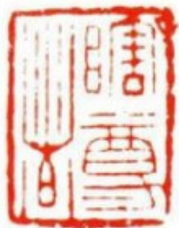
Илл. 2. Печать из альбома «Десять пейзажей» (слева) и образец печати Шитао из справочника «Печати и подписи китайских живописцев и каллиграфов» (справа)

тушью, которая не проникла в бумагу и засохла на поверхности. При проведении оформительских работ тушь «поплыла» и размазалась. Великий мастер не мог допустить подобную оплошность.