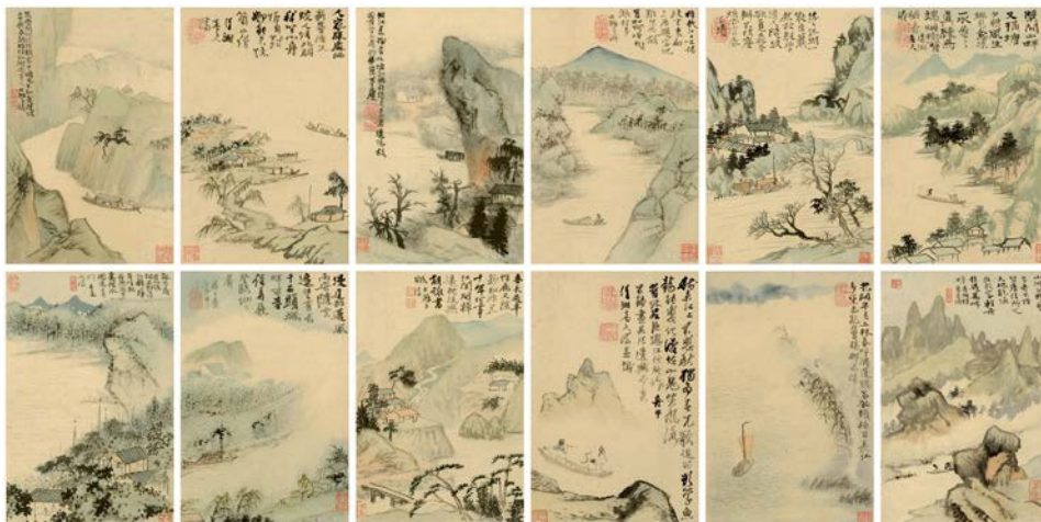
Илл. 3. Альбом «Странствие по реке». Бумага, тушь, краски. Частная коллекция, Китай

К проблеме атрибуции альбомов «Десять пейзажей» и «Странствие по реке [кисти] Шитао»