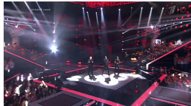
Илл. 9. Скриншот телевизионного кадра из программы «Голос». Первый канал

заполняют кадровое окно (см. илл. 9 (9) ). Говоря о дополнительном уплотнении экранного пространства необходимо отметить прием, задействующий линии и в ином формате. В перпендикулярной про-