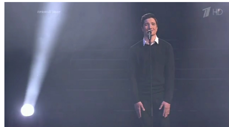
Илл. 8. Скриншот телевизионного кадра из программы «Голос». Первый канал