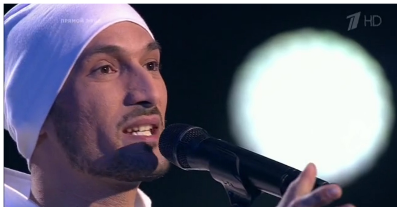
Илл. 10. Скриншот телевизионного кадра из программы «Голос». Первый канал