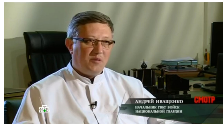
Илл. 1. Скриншот телевизионного кадра со статичными полосами на фоне, программа «Смотр». НТВ

Мы мысленно представляем линию, когда думаем о маршруте предстоящей поездки или линии горизонта. «Линия – это факт нашего восприятия. Она существует только у нас в голове. Линия – результат восприятия нами других зрительных компонентов, которые позволяют нам осознавать линию, однако ни одна из линий в реальности не существует. Форма так же, как и линия, является воображаемой,