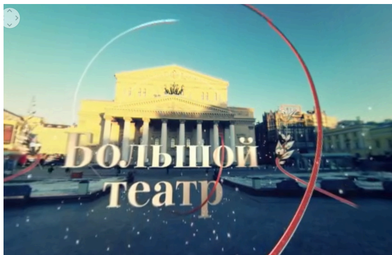
Илл. 3. Скриншот кадра из «видео 360» с использованием дополнительной визуализированной информации.