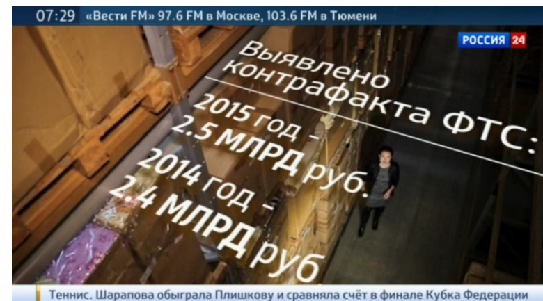
Илл. 4. Скриншот телевизионного кадра с использованием дополнительной визуализированной информации. Россия 24

При исследовании линии как образной составляющей структуры телекадра возникает вопрос: какой фактор при визуализации экранного пространства влияет на добавление в мизансцену прямых или изогнутых динамических линий?