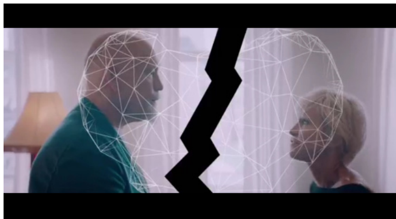
Илл. 12. Кадр из кинофильма «Про любовь. Только для взрослых», режиссеры Анна Меликян, Резо Гигинеишвили, Павел Руминов, Наталья Меркулова, Нигина Сайфуллаева, Алексей Чупов, Евгений Шелякин. 2017, Россия

прием разделения условной сферы размещения героев (см. илл. 12). Иммануил Кант писал: «Пространство есть необходимое априорное представление, лежащее в основе всех внешних созерцаний» [2, с. 64]. Разделение героев «ломаной» линией в экранном пространстве схематически может предвосхищать и разлом их личных отношений.