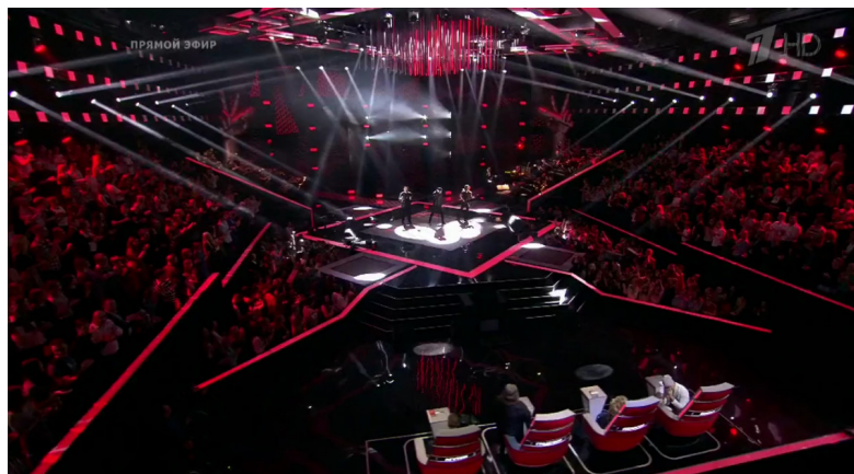
Илл. 7. Скриншот телевизионного кадра из программы «Голос». Первый канал

Вместе с тем в экранном пространстве, которое отображает зрительный зал при световом шоу, художественный образ линии довольно часто определяется лучом прожектора. С помощью современных осветительных приборов в «дымовой» среде сцены след луча обретает визуальную телесность, подчеркивая геометрию мизансцены. Световая декорация получает свое распространение из-за, казалось бы, простоты выстраивания сценического пространства – создания из «ничего». Так несколько световых струн визуальнo воссоздают плоскость задника съемочной площадки. Нить света, размечающая кулисы музыкального подиума, в экранном пространстве плавно переходит в грациозную линию декорации шоу, имеющую, в отличие от луча софита, изогнутую форму (см. илл. 7 (7) ).