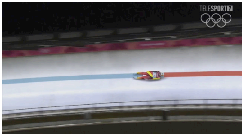
Илл. 5. Скриншот телевизионного кадра с линией как дополненной реальностью в виде вектора направления движения спортсмена. Телетрансляция TELESPORT7

изгибам как бы стремится превратиться в плоскость, „складчатая“ же плоскость – в объемную фигуру» [7, с. 15]. Таким образом, в художественном образе линии кроется потенциал визуального уплотнения объема экранного пространства (см. илл. 4 (4) ).