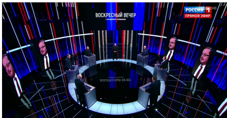
Илл. 11. Скриншот телевизионного кадра из программы «Воскресный вечер с Владимиром Соловьевым». Россия 1 HD

екции геометрически линия представляется в виде точки. В мизансцене такая трансформация возможна при наблюдении исходящего луча к объективу телекамеры под прямым углом.