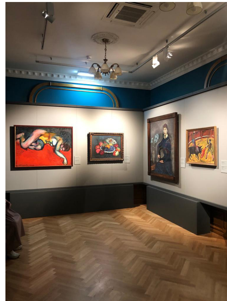
Ил. 2-4. Фрагменты экспозиции «Энергия цвета. Архетипы авангарда». Приморская государственная картинная галерея. Владивосток / Гос. Третьяковская галерея, 2023