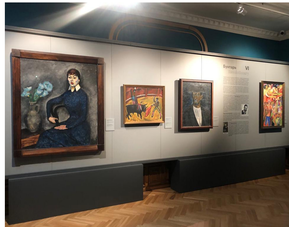
Ил. 5-7. Фрагменты экспозиции «Энергия цвета. Архетипы авангарда». Приморская государственная картинная галерея. Владивосток / Гос. Третьяковская галерея, 2023