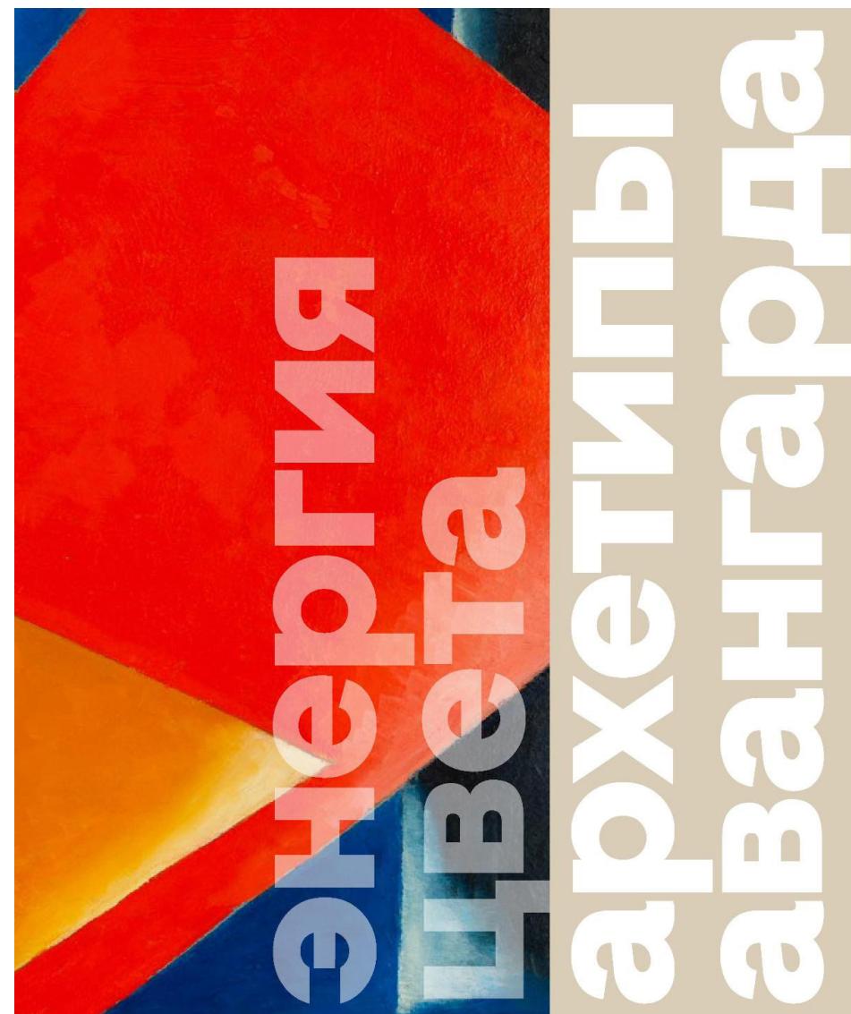
Илл. 1. Энергия цвета. Архетипы авангарда: [Альбом-каталог выставки] / Гос. Третьяковская галерея. М., 2023. 140 с.