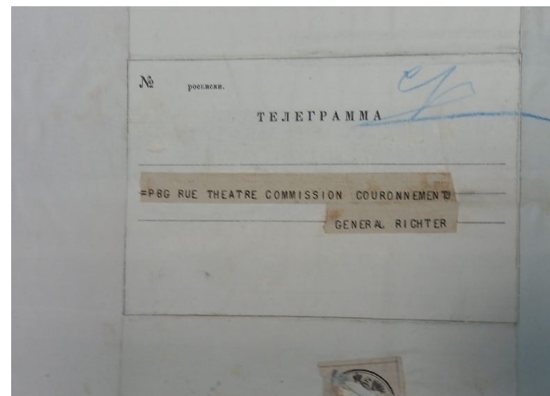
Ил. 3. П.И. Чайковский. Телеграмма П.А. Рихтеру. Париж, 17 (29) апреля 1883 года. Обратная сторона с адресом. РГИА. Ф. 472. Оп. 64. Д. 6. Л. 208 об.