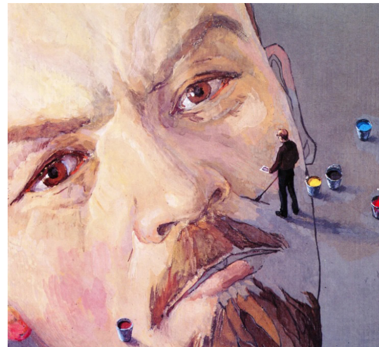
Ил. 3. Белов П.А. Великий Ленин. 1985. Картон, темпера, гуашь. 29,9 × 33,5 см. Государственный музей истории ГУЛАГа, Москва

Феномен постпамяти и его эстетика на примере «антисталинского цикла» Петра Белова