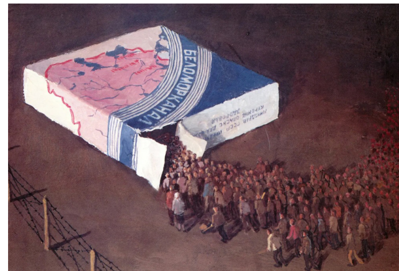
Ил. 1. Белов П.А. Беломорканал. 1985. Картон, темпера, гуашь. 24 × 35,4 см. Государственный музей истории ГУЛАГа, Москва

Художник использует здесь узнаваемый символ советской повседневности — пачку папирос «Беломорканал», которые были массово распространены в СССР главным образом из-за своей низкой цены. Люди в толпе изображены со спины, они одинаково одеты в простую одежду неярких цветов, обезличены. При «входе» в пачку самых дешевых сигарет их жизни как бы символически теряют свою ценность, судьба каждого отдельно взятого человека становится лишь одной из множества историй пострадавших и погибших во имя Великих строек. Стоит отметить, что из открытой пачки «Беломорканала» художник не изображает выхода: люди, попавшие туда, не имеют возможности вернуться. Цветовая гамма картины по большей части построена на темных серо-коричневых тонах: так окрашено почти все пространство картины в отсутствие воздушной перспективы и светотеневого контраста, одежда людей и заградительные столбы с натянутой колючей проволокой. Единственное цветовое пятно — это пачка папирос, акцентирующая на себе внимание зрителя и являющаяся «отправным» смыслом среди объектов. Интересным также