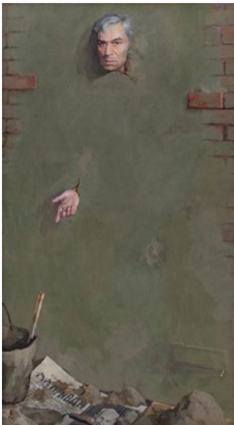
Ил. 5. Белов П.А. Пастернак. 1987. Картон, темпера, гуашь. 80 × 43,5 см. Государственный музей истории ГУЛАГа, Москва

Перед Хрущевым за Пастернака пытались вступить индийский политический деятель Джавахарлал Неру и французский философ и писатель Альбер Камю, но это не принесло результатов. Писатель был вынужден отказаться от Нобелевской премии, но отказался покинуть страну в письме Н.С. Хрущеву: «Выезд за пределы моей Родины для меня равносителен смерти, и поэтому я прошу не принимать по отношению ко мне этой крайней меры» (1) . В конечном итоге травля привела писателя к обострению болезней и скорой смерти.