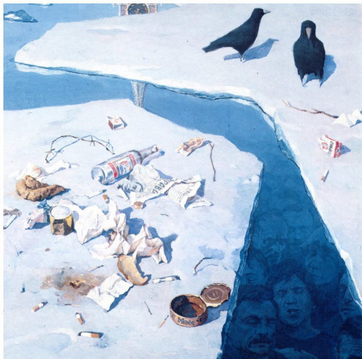
Ил. 4. Белов П.А. Грачи прилетели, или Апрельский пленум. 1987. Холст, темпера, гуашь. 75,7 × 75,5 см. Государственный музей истории ГУЛАГа, Москва

одна из кремлевских башен на Красной площади. Большую часть холста занимает изображение льда, покрывающего реку; на одной из льдин — грачи, на другой — разбросанный мусор: окурки, смятые письма и газеты, консервные банки и обрывки колючей проволоки.