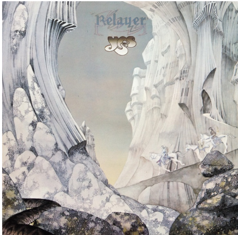
Илл. 2. Группа Yes, альбом «Relayer» (1974). Художник – Роджер Дин (Roger Dean)

с джазовым или блюзовым, ассоциируется с природным морским рифом, на который накатываются громадные волны. Технически же он представляет многократно повторяющийся рефрен. Энциклопедический словарь Мерриам-Уэбстер, в частности, указывает, что «рифф» происходит от сокращенного refrains , означающего не только «рефрен», но и глагольную форму «сдерживать», «удерживать» (3) . В этом значении акцентируется повторная, остиная функция риффа, особенно актуальная для рока. Удивительный термин, удивительно его происхождение – неожиданное и непосредственно связанное