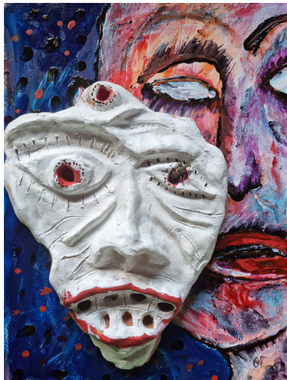
Ил. 6. Гуров О.Н. Из серии «Вселенная „Рик и Морти“». 2022. Картон, акрил, глина. 40 × 60 см. Из личной коллекции автора