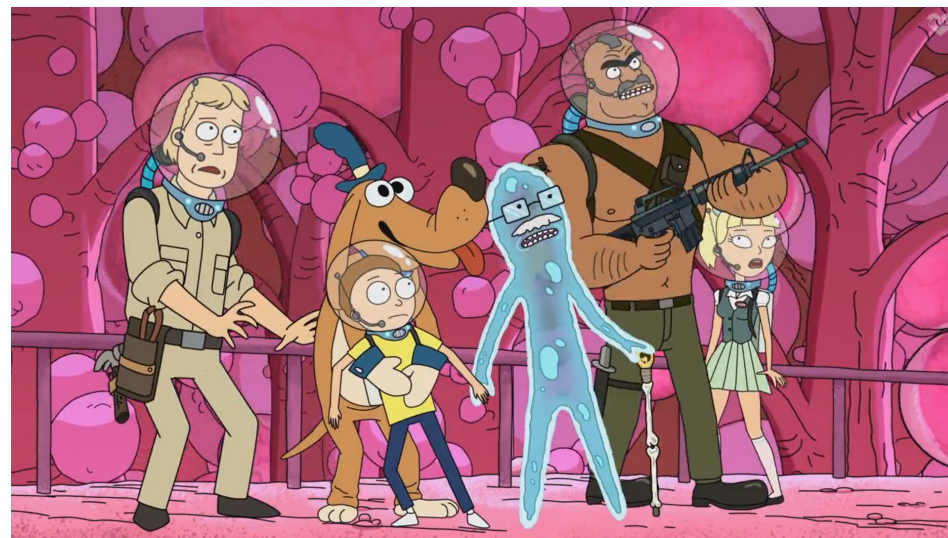
Ил. 8. Кадр из сериала «Рик и Морти» (Rick and Morty), авторы Дж. Ройланд и Д. Хармон, с 2017 года по настоящее время

Выше мы упоминали статью С.Н. Оводовой и Д.В. Добротворского, посвященную нарративу мультсериала в контексте постмодернизма и метамодернизма. По нашему мнению, метамодернизм нельзя считать обоснованным направлением в философии, тем более что он не подтвержден и не подкреплен значимыми исследованиями и художественными работами. Мы воспринимаем метамодернизм как одну из спекулятивных попыток интерпретировать мир постмодерна, который не лишен динамики и в последнее время приобрел новые черты и качества, недоступные теоретикам постмодерна в прошлом. В этом смысле метамодернизм отражает парадигму инфантильного потребителя медиа и сетевого контента. Поэтому далее мы рассмотрим сериал «Рик и Морти» именно с тех позиций, которые метамодернизм ставит себе в заслугу (подразумевая, что метамодернизм выполняет здесь техническую квалификационную функцию) — с точки зрения того, что произведения культуры становятся сложными, комплексными, и их рефлексия позволяет зрителю испытать широкий спектр разнообразных эмоций.