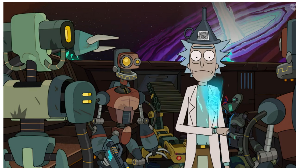
Ил. 2. Кадр из сериала «Рик и Морти» (Rick and Morty), авторы Дж. Ройланд и Д. Хармон, с 2017 года по настоящее время

Юмор, представленный в сериале, — очень специфический и фактически не имеет табу. Авторам удается с успехом лавировать в непростых условиях так называемой новой этики и культуры отмены. В различных эпизодах высмеивается очень многое: стандартные подростковые проблемы и травматичные аспекты взросления; сомнительное качество массовой культуры, в частности кинематографа, и ее ограничивающий человеческое развитие потенциал; межличностные и социальные отношения, включая гендерные, расовые и пр. актуальные вопросы; политика — вплоть до геополитики и политики в космосе. В 2018 году Хармона пытались заклеить и даже привлечь к ответственности за ненадолго размещенную в 2009 году непристойную короткометражку, однако ему удалось отделаться извинением и заявлением, что это была неудачная пародия на популярный сериал [11].