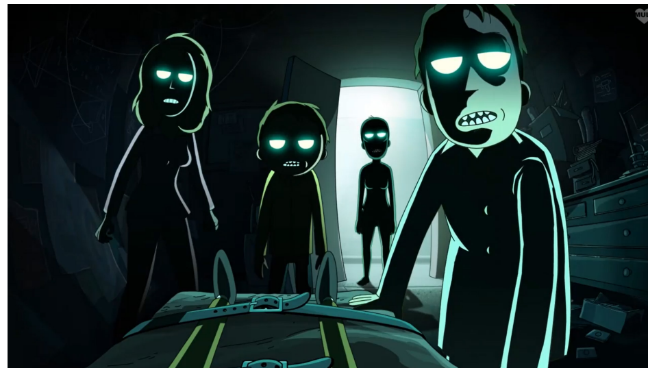
Илл. 1. Кадр из сериала «Рик и Морти» (Rick and Morty), авторы Дж. Ройланд и Д. Хармон, с 2017 года по настоящее время

Кроме того, что все эпизоды сериала предлагают оригинальные и часто непредсказуемые сюжетные решения и наполнены искрометным и очень своеобразным юмором, «Рик и Морти» в некотором роде отражает и интерпретирует целый ряд глубоких и актуальных для человечества вопросов. Сериал представляет собой интересный материал, позволяющий продуктивно интерпретировать важные философские и культурологические проблемы. В рамках данной статьи мы остановимся, во-первых, на проблеме реальности (в смысле действительности, истинности) существования и, во-вторых, на противопоставлении детерминизма и свободы — все это в условиях совре-